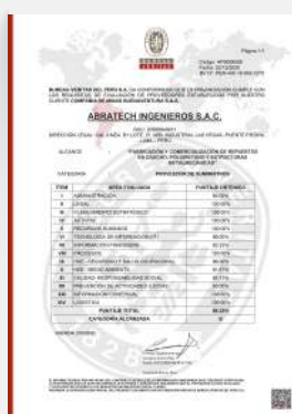
HOMOLOGACIÓN MINERA BUENAVENTURA