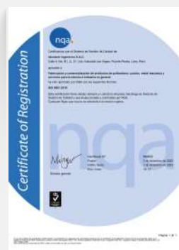
CERTIFICACIÓN ISO 9001 : 2015