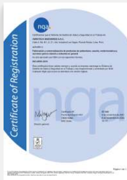
CERTIFICACIÓN ISO 45001 : 2018