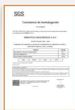
HOMOLOGACIÓN MINERA LAS BAMBAS